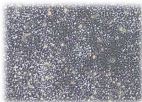
培養 8 日の PXB-cells