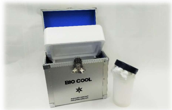
感染源 輸送用ボックス一式